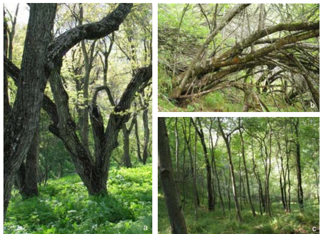
a) 100-150 Jahre alte Walnussbäume; b) Wildapfelbaum; c) Aufgeforstete Walnussbäume