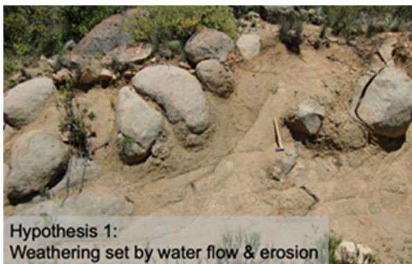
Hypothesis 1: Weathering set by water flow & erosion

Ziel des DEVENDRA-Projekts ist die Entwicklung innovativer Methoden zur Quantifizierung der Auflösung von Basalt- und Karbonatgesteinen und die Entschlüsselung ihrer Auswirkungen auf die Vegetation und das Klimasystem der Erde.