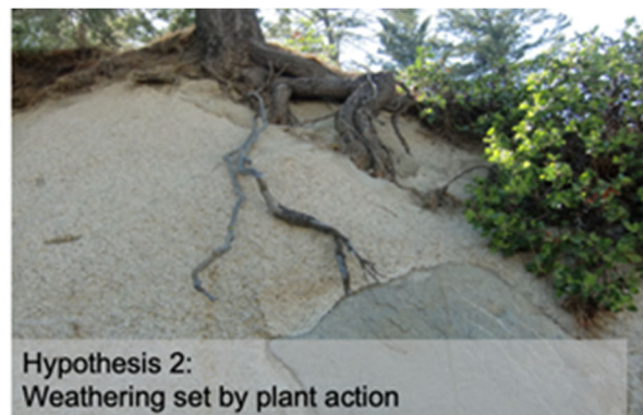
Hypothesis 2: Weathering set by plant action