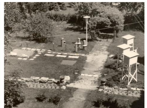
Podbielskiallee 62 - für über 3 Jahrzehnte der Hauptsitz des Instituts seit dem umzug vom Kiebitzweg am 3. Oktober 1951, bis zur Verlagerung auf den Fichtenberg am 26. Oktober 1983. Die Messwiese und Messeinrichtungen des Hauses konnten noch bis zur voll-ständigen Aufgabe des Standortes am 11. Juli 1997 weiter genutzt werden.