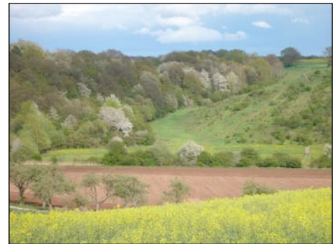
Abb. 2: Blick auf den Schwemmfächer

Das Untersuchungsgebiet liegt in Thüringen am südlichen Rand des Harzes nahe der Stadt Nordhausen. Das Südharzvorland bildet die nördliche Peripherie der zentralörtlich organisierten Latènekultur. Gegen Ende des zweiten Jahrhunderts vor Christus setzte ein Migrationsprozess der polnischen Prezworsk-Kultur in das Gebiet ein. Naturräumlich gehört die Region zum Nordthüringer Bundsandsteinland. Tiefe Erosionsrinnen weisen auf starke Erosionsereignisse in der Vergangenheit hin.