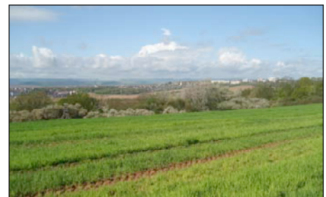
Abb. 5: Blick auf Nordhausen

Das historische und aktuelle Naturraumpotential im Randbereich der Goldenen Aue (R. Neef; Examensarbeit)