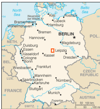
Abb. 1: Das Untersuchungsgebiet

1 Physische Geographie FUB, 2 Geophysik FUB, 3 Prähistorische Archäologie FUB