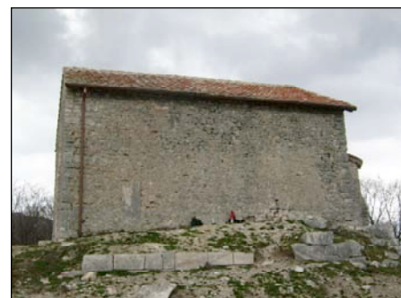
Abb. 4: Kirche San Giovanni mit antikem Fundament (2. Jhr. vor Christus)