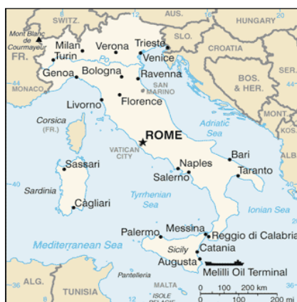
Abb. 1: Lage des Untersuchungsgebiets in Italien

1 Institut für Klassische Archäologie der FUB, 2 Institut für Physische Geographie der FUB